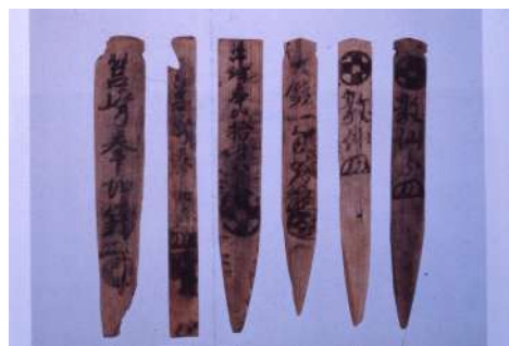
新安沈没船発見の木簡