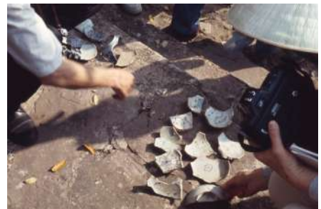
ベトナム・ホイアン付近での肥前磁器採集