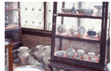
タイのスコタイ焼