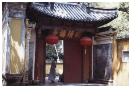
名刹・天台山国清寺