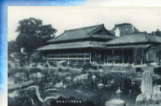
柳河伯爵立花家庭園の絵葉書 (九州歴史資料館所蔵)