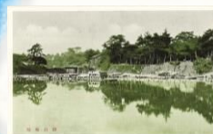
勝山城址の絵葉書