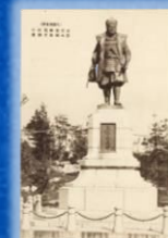
水天宮神苑内の 真宗和泉守銅像の絵葉書 (九州歴史資料館所蔵)