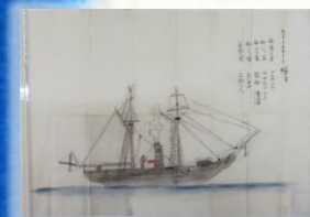
魯西亜船図 (個人蔵)