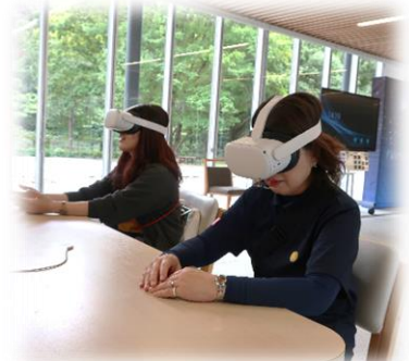
【VR体験】 最新の科学技術でリアルな体験