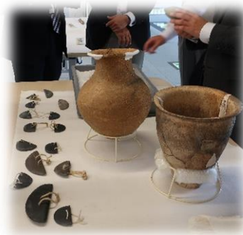
【ハンズオン体験】 本物の土器等に触れる体験