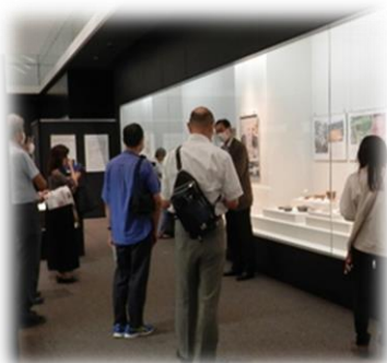
【ミュージアムトーク】 展示室で学芸員が解説

主催:九州歴史資料館 共催:国立科学博物館、公益財団法人日本博物館協会 後援:文部科学省