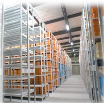
【バックヤードツアー】