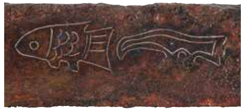
伝群馬県藤岡市西平井 象嵌鉄刀(部分) 古墳時代・6世紀 九州国立博物館所蔵