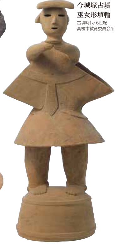
今城塚古墳 巫女形埴輪 古墳時代・6世紀 高槻市教育委員会所蔵