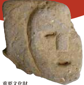
重要文化財 岩戸山古墳 武人形石製表飾 古墳時代・6世紀 八女市教育委員会所蔵