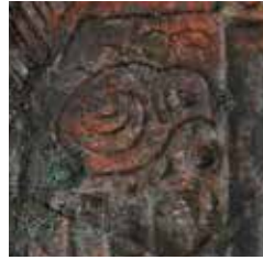
小都市指定文化財 津古生掛古墳 方格規矩鏡(部分) 古墳時代・3世紀 小都市教育委員会所蔵