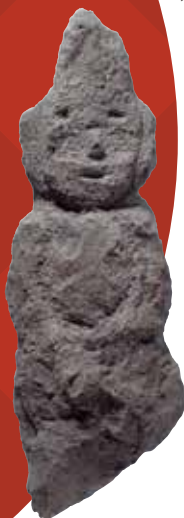
木柑子高塚古墳 人形石製表飾 古墳時代・6世紀 熊本県立茶臼山古墳館所蔵