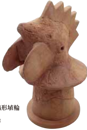
今城塚古墳 鶏形埴輪 古墳時代・6世紀 高槻市教育委員会所蔵