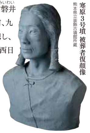
寒原3号墳 被葬者復顔像 熊本県立茶臼山古墳館所蔵

『日本書紀』が継体天皇21年(527年)に勃発したと伝える筑紫君磐井の乱は、日本列島の国家形成を揺るがす内乱でした。乱以前、九州北部の豪族・筑紫君磐井は、筑紫・火・豊の豪族と連携し、有明首長連合の盟主として指導力を発揮するとともに、西日本各地や朝鮮半島諸国との独自交流を重ねていました。この特別展では、筑紫君の勃興から、磐井の乱、その後のヤマト王権による九州支配の形成、「日本国」の成立にいたるまでの歴史を、ツクシの視点から捉え直し、筑紫君一族が国家形成過程ではたした役割を明らかにします。