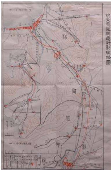
「筑紫電気軌道株式会社概要」に掲載の同路線計画図

さらに兼営の電力事業などの状態も記載した営業報告書や、駅に併設したターミナルデパートの絵葉書など、関連事業の姿を伝える文書も残されています。