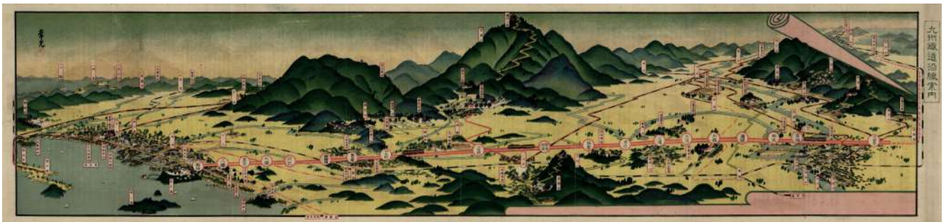
大正13年(1924)の九州鉄道福岡～久留米開通時に発行された「九州鉄道沿線案内」(金子常光原画・当館蔵)

その後、県内では小規模な私鉄や、道路上にレールを敷いて車両を走らせる軌道が、各地に開通しました。その一つ、福岡市で軌道を敷設していた福博電気軌道(後に九州電灯鉄道や福博電車を経て西鉄に統合)の関係者たちが、福岡市と久留米方面を結ぶ高速電車の事業を構想し、大正2年(1913)に筑紫電気軌道の敷設を国に申請します。この会社は大正11年、九州鉄道と改称し、この二代目の九州鉄道が大正13年に、福岡～久留米間を開通させました。そして順次延伸を重ね、昭和14年に大牟田まで全通しました。