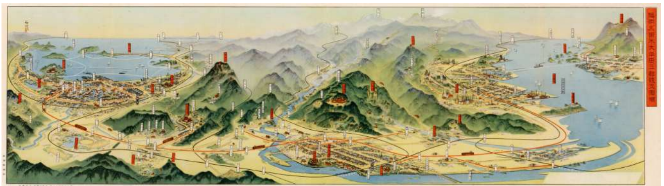
昭和14年(1939)の九州鉄道大牟田延伸時に製作された「福岡・久留米・大牟田三都観光図絵」(前田虹映原画・当館蔵)