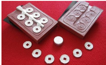
和同開珎、ミニ銅矛、ミニ銅鏡