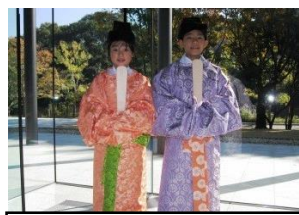
古代衣装着付け体験