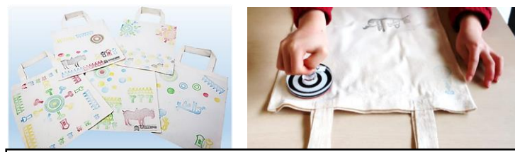
NEW! 装飾古墳トートバッグづくり