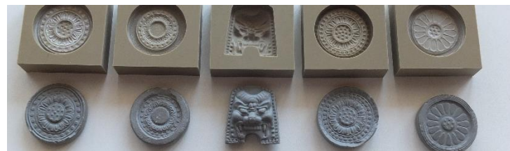
瓦マグネット(鬼瓦・軒丸瓦)