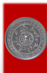
和同開珎、三二銅矛、三二銅鏡