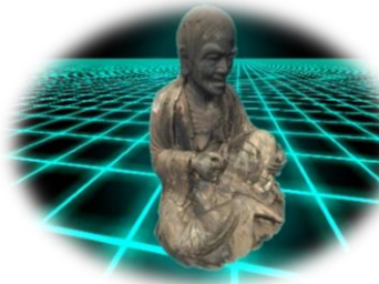
VR体験 (像の中に入ってみましょう)