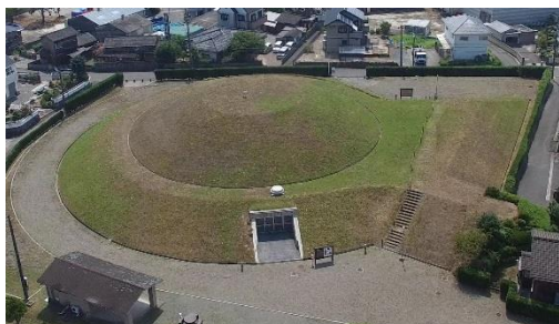
上空から見た様子