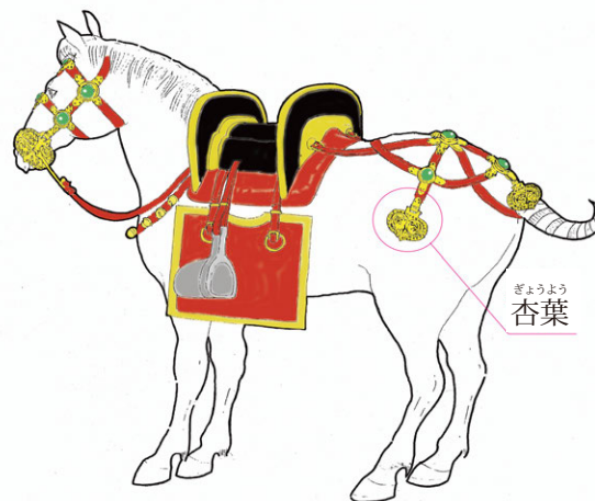
▲ 船原古墳の馬装復元図

古代のタマムシを使った装飾品は、日本と朝鮮半島合わせて 13 か所でしか確認できない希少品です。さらに、玉虫装飾の馬具は 5 世紀代の新羅の王陵級古墳で出土するため、最も高貴な人々だけが使うことを許された、最高級品の馬具であったと考えられています。日本では、有名な法隆寺玉虫厨子のほか、世界遺産沖ノ島、正倉院中倉に玉虫装飾品があり、ほとんどが国宝に指定されていますが、馬具にタマムシが使われた確実な例はこれまでありませんでした。本杏葉は、国内で唯一確実な玉虫装飾馬具として、また当時の日本と朝鮮半島との関係や船原古墳に眠る被葬者の解明に向けて、注目される資料です。（古賀市教育委員会 西幸子）