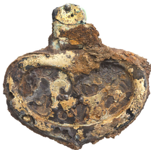
▲ 二連三葉文心葉形杏葉