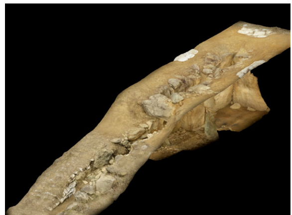
▲ VRコンテンツ：船原古墳（石室）