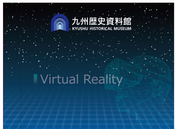
▲ VRコンテンツ：バナー