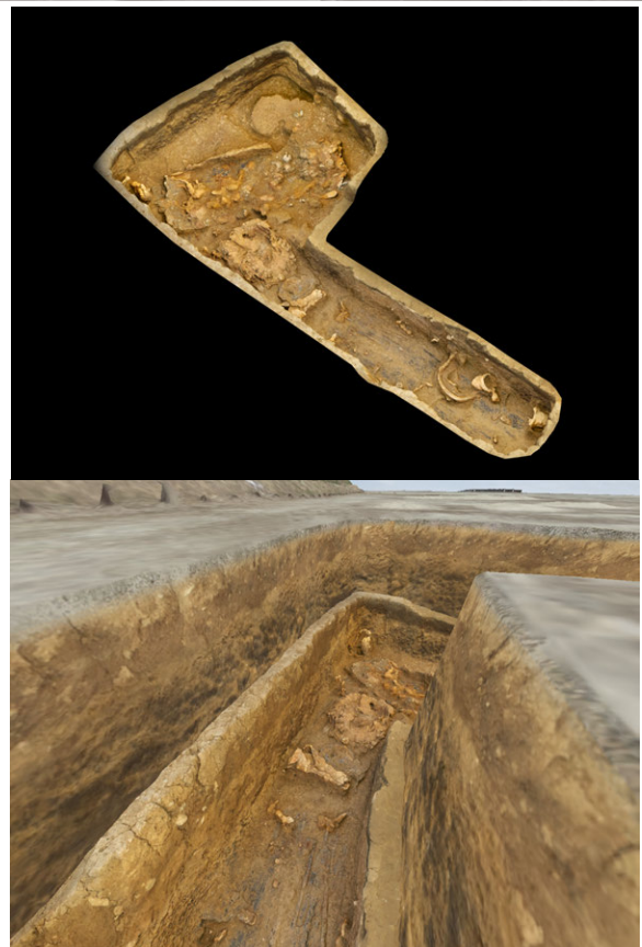
▲ VRコンテンツ：1号土坑（遺物埋納坑）