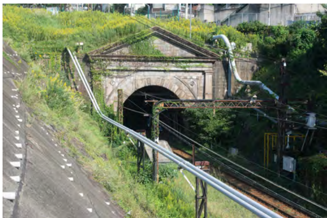
ルネサンス様式の意匠で装飾された炭滓線の宮田山トンネル