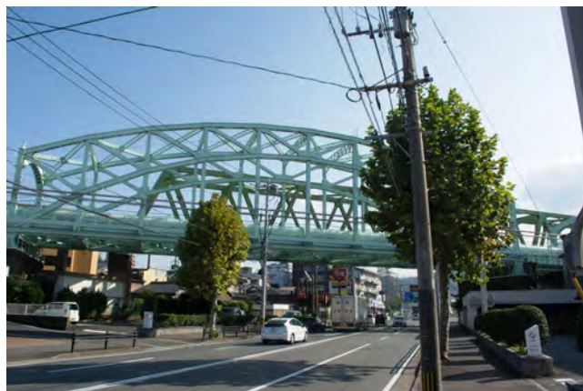
大型のタイドアーチ橋である炭滓線の枝光橋梁