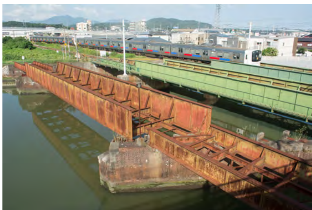
鹿児島本線と共に遠賀川駅付近に架かる旧室木線の橋梁

この北九州線の内、平成12年に全廃されるまで残っていた黒崎駅前～折尾間には、現在も当時の面影を伝える鉄道遺産が点在しています。その中でも最大のもは、終点折尾に建造された高架橋です。この高架橋は、九州電気軌道が折尾まで到達した大正3年に建造されたもので、九つのレンガアーチが連なっていました。現在も三連のレンガアーチが残され、その中でも線路と道路が斜めに交差するアーチには、レンガを斜めに積み上げる「ねじりまんぼ」の工法が採用されています。