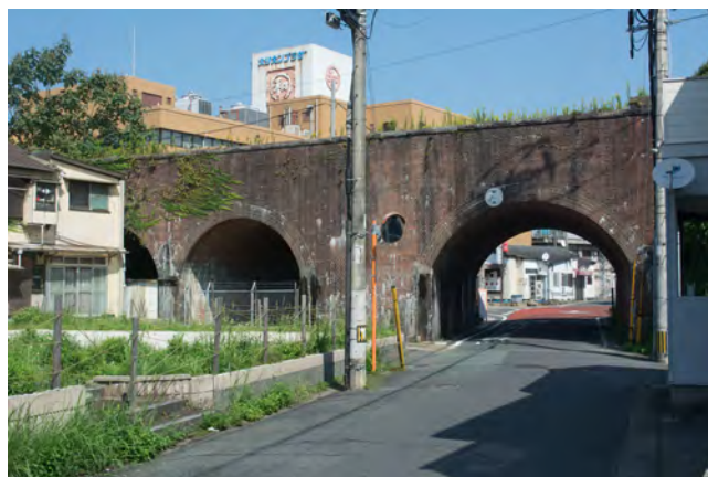
三連のレンガアーチが美しい旧西鉄北九州線の折尾高架橋