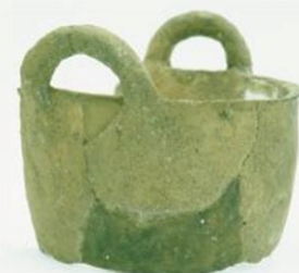
把手付甕（新宮町指定文化財）

JR 鹿児島本線「新宮中央駅」から徒歩 10 分 西鉄バス「新宮中原」バス停から徒歩 10 分 福岡都市高速道路 香椎東ランプから約 10 分