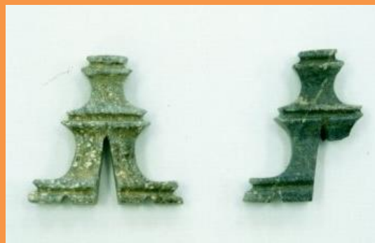
琴柱形石製品（人丸古墳）