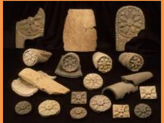
上岩田遺跡出土瓦