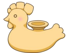
イメージキャラクター つこっコ