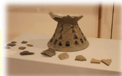
石人山古墳出土初期須恵器