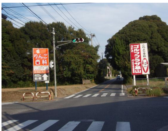
③ この信号を左折する