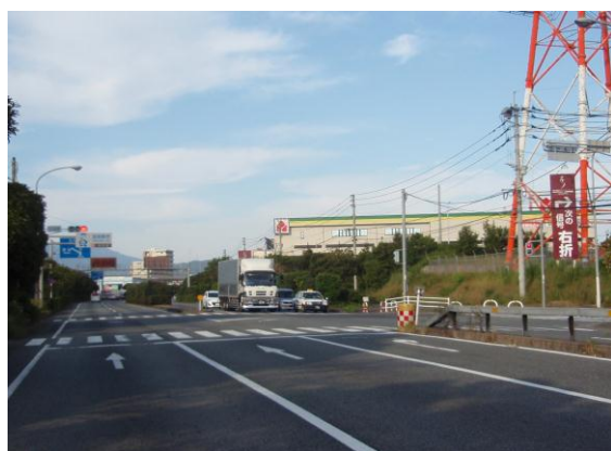
② 「三国境」信号を右折する