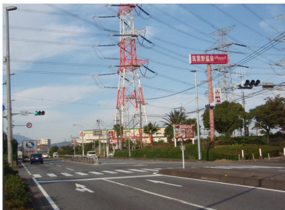
① 「三国」信号（この信号の次が三国境）

自動車道は「鳥栖IC」を「筑紫野・基山」方面に降り、国道3号線に出る。国道3号線「三国境」信号を右折、2.5km先の次の信号を左折、次の十字路（止まれ）を右折し、九州歴史資料館の案内標識(右側に茶色のマンション)を左折し0.5km。(鳥栖インター出口から9.5km、三国境の信号から4km)