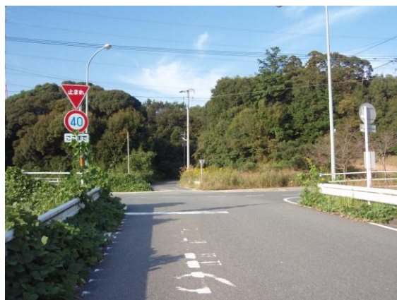
④ この十字路を右折する