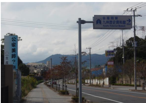
⑤九州歴史資料館案内標識を右折する