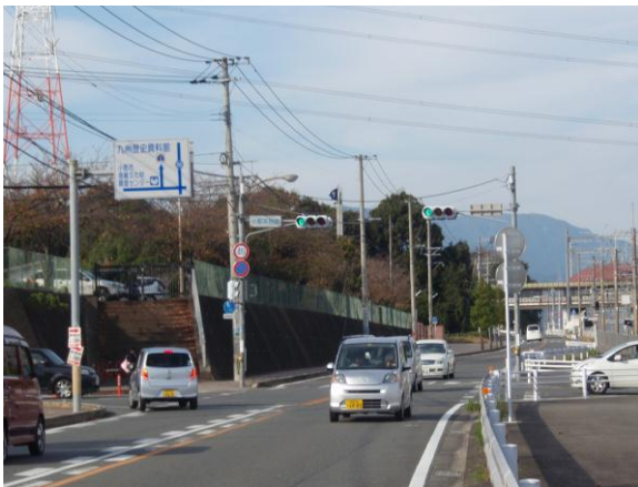
③「小郡高校前」信号を左折する