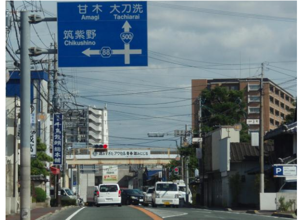
②「小郡小学校前」信号を筑紫野方面へ左折する