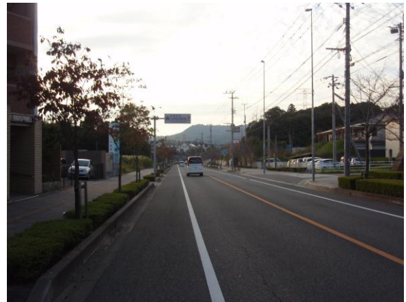
④九州歴史資料館入口手前