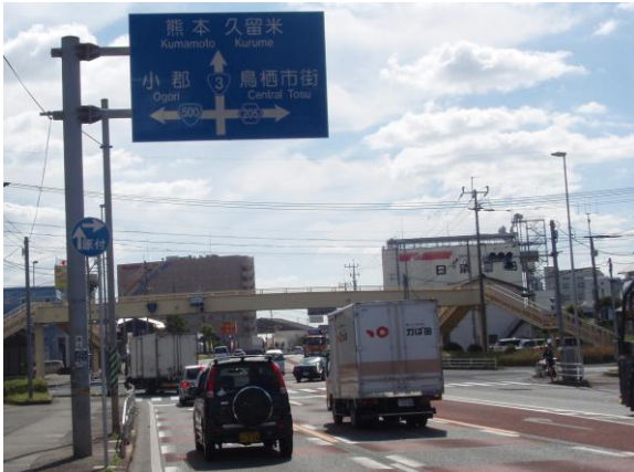
①「姫方町」信号を小郡方面へ左折する

自動車道は「鳥栖IC」を「鳥栖・久留米・小郡」方面に降り、国道3号線に出て「姫方町」信号を小郡方面へ左折（国道500号線）、2km先の「小郡小学校前」信号を筑紫野方面へ左折（県道88号線）、4.5km先の「小郡高校前」信号を左折、九州歴史資料館の案内標識(左側に茶色のマンシヨンを)を右折し0.5km。(鳥栖IC出口から8km)