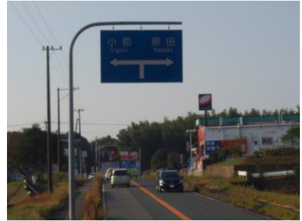
① 降口手前(小郡方面へ降りる) ② 信号を小郡方面へ左折する ③ 突き当りの信号を左折する