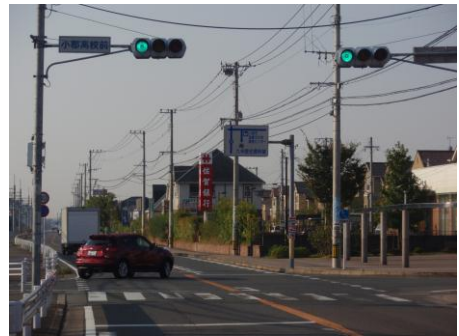
④ 小郡市街方面に進む ⑤ 左車線先信号を右折する ⑥ 「小郡高校前」信号を右折する