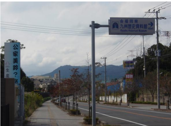
⑦ 九州歴史資料館案内標識を右折する