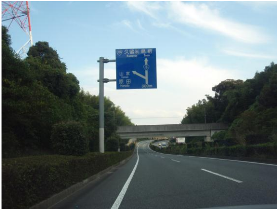
① 「山家・原田」出口手前

国道3号線の「城山（きやま）」信号を通過した先にある「山家・原田」出口で降り、「筑紫野バイパス北」信号を原田方面へ右折、4 km先の九州歴史資料館案内標識(右側に茶色のマンション)を左折し0.5 km。