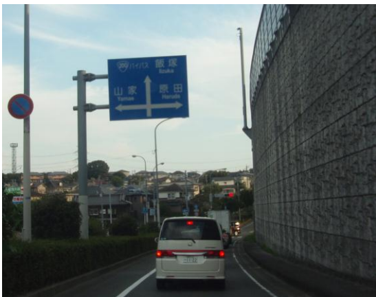
③ 「筑紫野バイパス北」信号を右折する