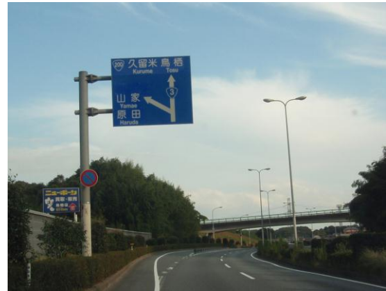
② 「山家・原田」出口を降りる