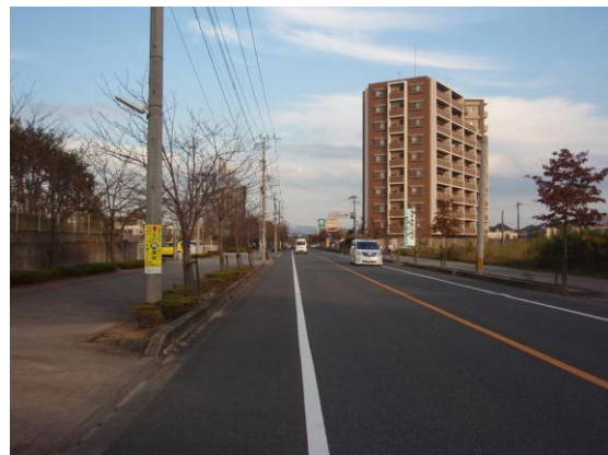
④ 九州歴史資料館入口手前