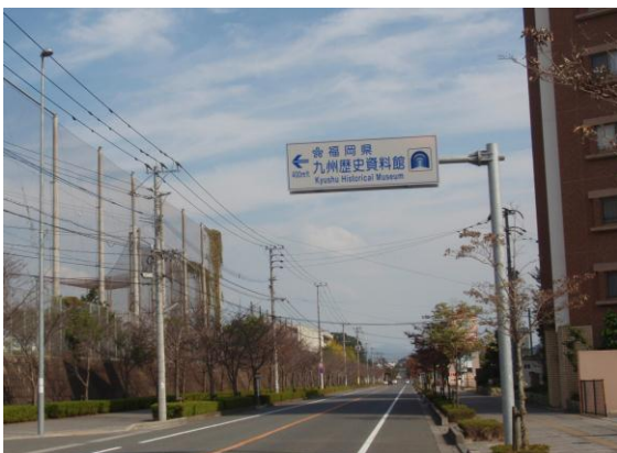
⑤ 九州歴史資料館案内標識を左折する。