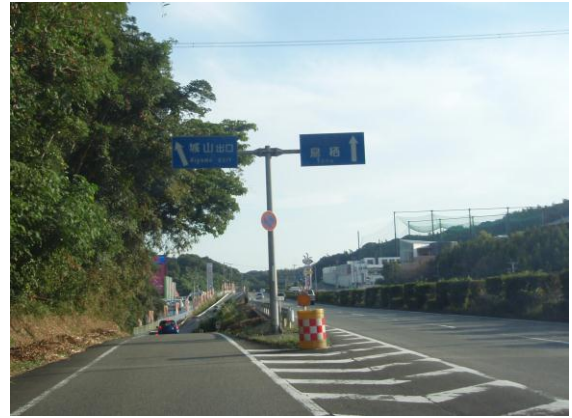
② 「城山」出口を降りて左折する