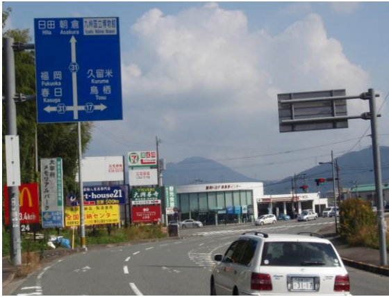
① 「武蔵交差点」信号を右折する

九州自動車道の「筑紫野 I C」を降り、「武蔵交差点」信号を久留米・鳥栖方面に右折（県道 17 号線[鳥栖筑紫野道路]）、「城山（きやま）」出口を原田方面へ左折、「筑紫神社東」信号を右折、3 km 先の九州歴史資料館の案内標識(右側に茶色のマンション)を左折し 0.5 km。（「武蔵交差点」信号から 9.5 km）