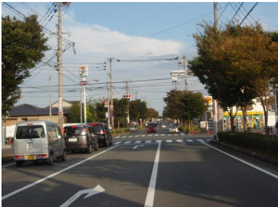
③ 「筑紫神社東」信号を右折する