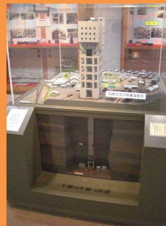
旧志免鉱業所竪坑櫓 模型