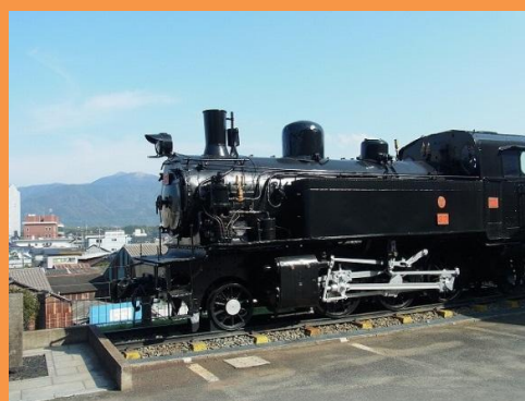
SL コッペル 32