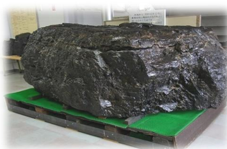
日本最大級 2tの石炭塊