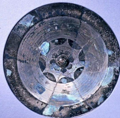
国宝 内行花文鏡【国 (文化庁) 保有】